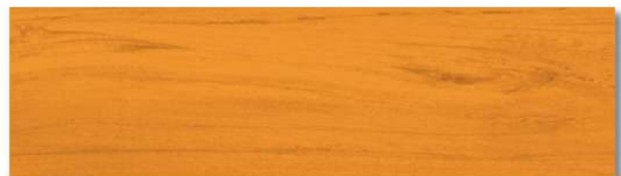
สีย้อมดี สีส้มสักทองพม่า - กึ่งเงา Burmese Golden Teak - Semi Gloss WS-205