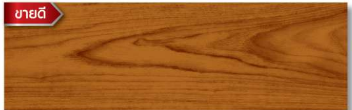
สีไม้สักล้านนา - เงา Lanna Teak - Gloss WG-106