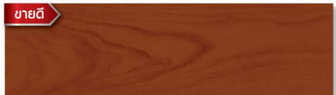
สีย้อมดี สีส้มสัก - กึ่งเงา Teak - Semi Gloss WS-201