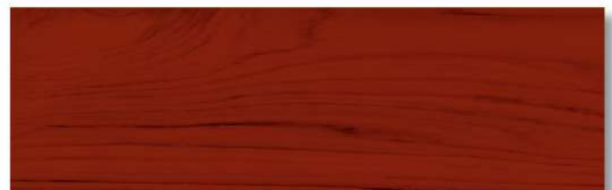
สีไม้แดง - ด้าน