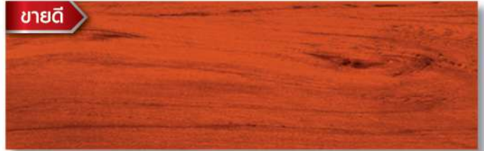
สีไม้มะฮอกกานี - เงา Mahogany - Gloss WG-102