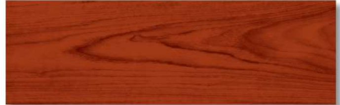
สีไม้มะฮอกกานี - ด้าน