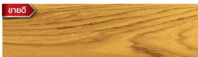
สีย้อมดี สีใสเงา Clear Gloss WC-301