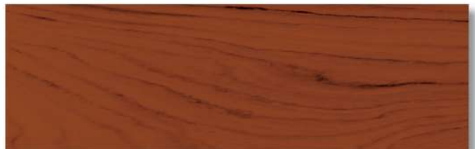
สีไม้แดงพม่า - เงา Myanmar Redwood - Gloss WG-105