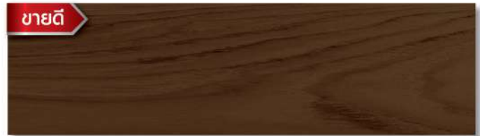
สีย้อมดี สีส้มประดู่ - กึ่งเงา Dark Oak - Semi Gloss WS-204