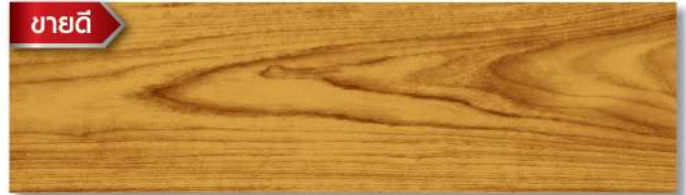
พื้นด้าน - สีใสด้าน Deck Matt - Clear Matt WD-501