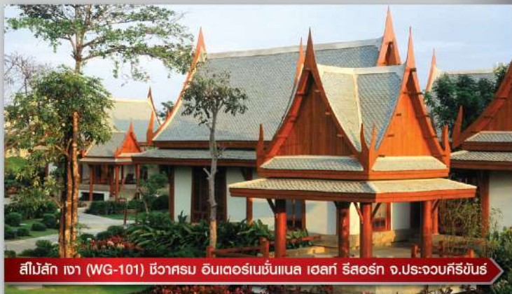
สีไม้สัก เงา (WG-101) ชิวาCRM อินเทอร์เน็ตเซ็นทรัล โฮเทล รีสอร์ท จ.ประจวบคีรีขันธ์