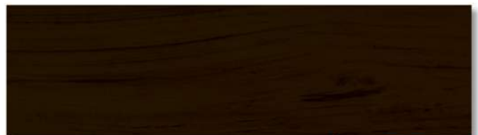
พื้นด้าน - สีไม้เบญจก้าน WD-505