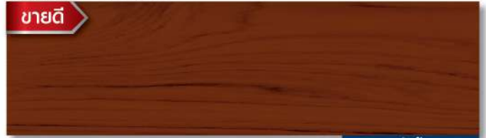
พื้นด้าน - สีไม้วอลนัท WD-504