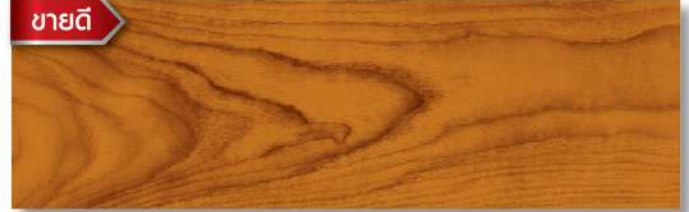
สีไม้สัก - ด้าน