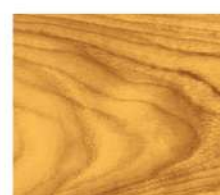
สีใสด้าน