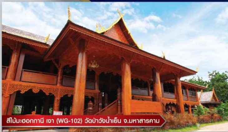
สีไม้-ออกกานี เงา (WG-102) วัดป่าวังน้ำเย็น จ.มหาสารคาม