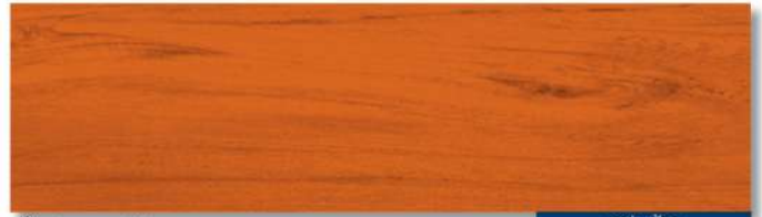
พื้นด้าน - สีไม้แดง WD-503