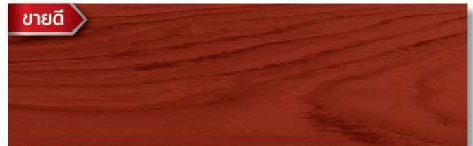
สีไม้มะค่า - ด้าน