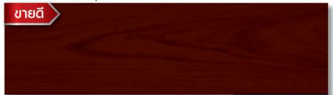
พื้นด้าน - สีไม้ประดู่ WD-507