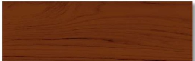
สีไม้วอลนัท - เงา Walnut - Gloss WG-103