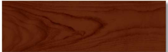
สีไม้พะยูง - เงา Siamese Rosewood - Gloss WG-107