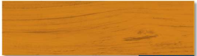
พื้นด้าน - สีไม้สัก WD-502