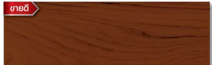
สีไม้วอลนัท - ด้าน