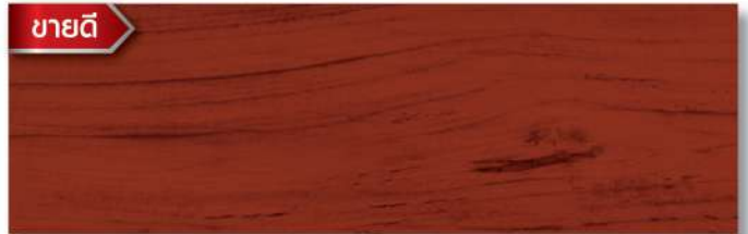
สีไม้กะคำ - เงา Pyinkado - Gloss WG-104