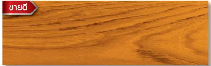
สีไม้สัก - เงา Burmese Teak - Gloss WG-101