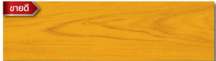
สีย้อมดี สีส้มสักทอง - กึ่งเงา Autumn Oak - Semi Gloss WS-202