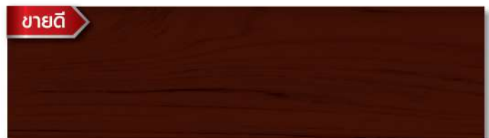
สีย้อมดี สีส้มประดู่หลวงพระบาง - กึ่งเงา Luang Prabang Afromosia - Semi Gloss WS-207