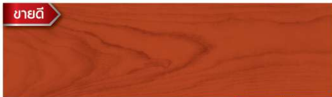
พื้นด้าน - สีมะฮอกกานี WD-508