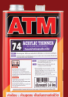
ทินเนอร์ผสมสีอะครีลิก เอทีเอ็ม # T74 0.85 ลิตร/ 3.4 ลิตร