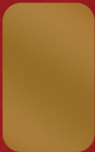
ATM Spray Gold Paint # G6000