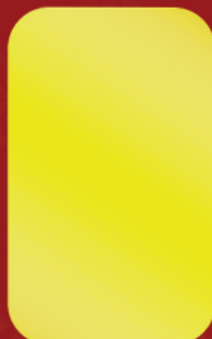
ATM Spray Gold Paint # C982