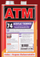
ทินเนอร์ผสมสีอะครีลิก เอทีเอ็ม # T74 0.85 ลิตร/ 3.4 ลิตร