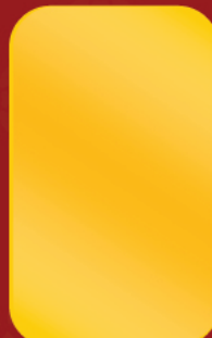
ATM Spray Gold Paint # C983